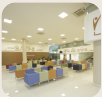
Espaço Dedicado à Dermatologia e Plástica Reconstructora Prevent Senior Los Angeles