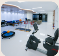
Espaço Dedicado à Reabilitação Prevent Senior Barcelona