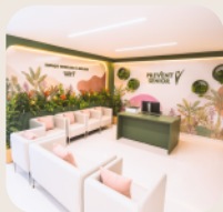
Espaço Dedicado à Mulher Unidade Brasil