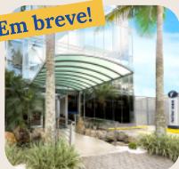
Espaço Dedicado ao Tratamento da Dor Prevent Senior Florença