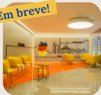
Espaço Dedicado ao Cuidado do Coração Prevent Senior Alemanha