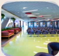
Espaço Dedicado ao Homem Unidade Londres