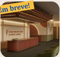
Espaço Dedicado à Saúde do Corpo e da Mente Prevent Senior Seul