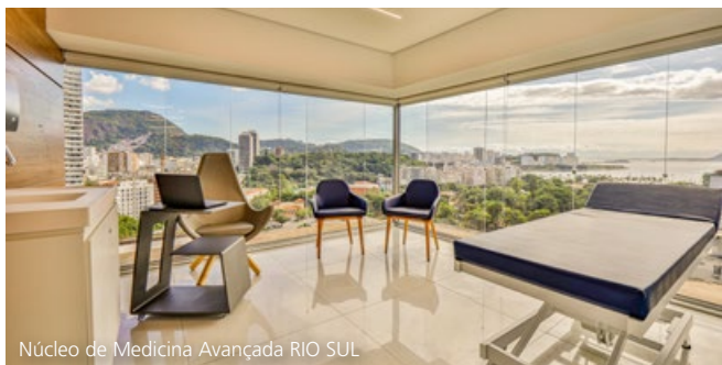
Núcleo de Medicina Avançada RIO SUL

A atuação da Prevent Senior no Rio de Janeiro trouxe um novo conceito sobre tecnologia e inovação no cuidado da saúde e do bem-estar e, desde 2019, segue conquistando a confiança dos cariocas. Hoje, os beneficiários já somam mais de 35 mil vidas.