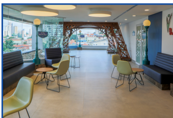
Hospital Sancta Maggiore Paris